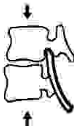
Fig. 2.—Segunda sesión. La disminución del espacio discal nos provocará compresión de la raíz nerviosa.