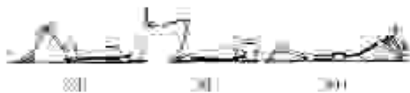
Fig. 4.—Cuarta sesión. Ejercicios.

En la EC se precisa que el paciente entienda el mensaje que se le transmite y esté motivado para